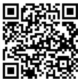
2022年经开区高企认定信息表

重新认定和新认定高企须扫描下方二维码填报《2022 年经开区高企认定信息表》。使用经开区高企服务券的填报时须上传企业与机构签署的高企申报服务协议进行备案，备案截止时间为 2022 年 6 月 30 日。已备案的高企服务券将于每月下旬在泰达政务网公布，未备案的高企服务券不予兑现。