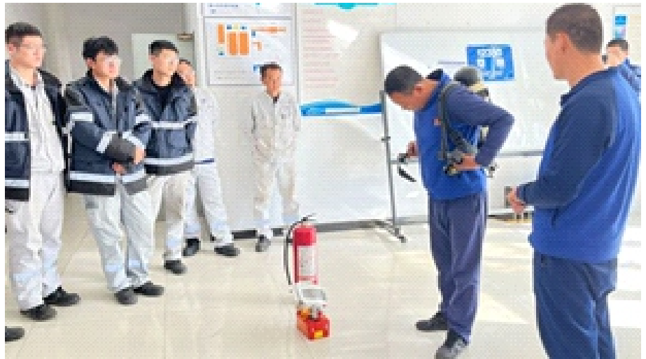
消防月培训及考核